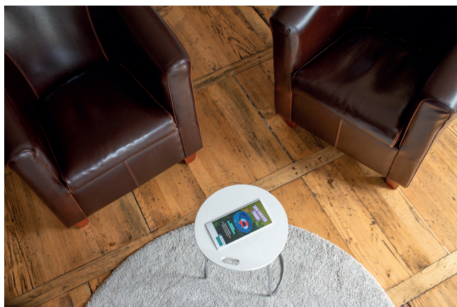
Bild: Unser Beratungsraum in Bern.

Unsere Strategie sieht einen schrittweisen Ausbau und die Etablierung des Angebots in der ganzen Deutschschweiz bis Ende 2028 vor. Dies zu erreichen ist nur möglich, wenn sich Kantone finanziell beteiligen. In dieser Hinsicht konnten wir 2025 erfreuliche Fortschritte machen. Im Kanton Bern haben wir eine mehrjährige Leistungsvereinbarung mit der Gesundheits-, Sozial- und Integrationsdirektion GSI abgeschlossen. Dadurch ist unser Angebot in Bern erstmals nachhaltig gesichert. Zudem konnten wir die Kantone Zug, Schwyz, Uri, Obwalden, Nidwalden und Glarus für ein regionales Projekt gewinnen. Dank Beiträgen aus den Lotteriefonds werden wir 2026 unser Angebot auf die Zentralschweiz ausweiten können.